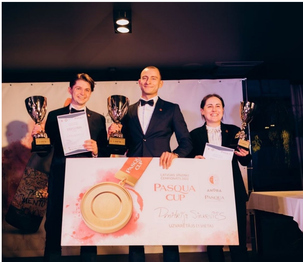
Latvijas vīnziņu čempionāta "Pasqua Cup 2022" pirmo trīs vietu ieguvēji.

Latvijas vīnziņu asociācija ik gadu pulcē jaunos Latvijas vīnziņus sacensties meistarībā, lai iegūtu gada vīnziņa titulu. Pirmo trīs vietu ieguvēji iegūst arī ceļazīmi uz Baltijas vīnziņu čempionātu Vana Tallinn Baltic Sommelier Grand Prix, kas ik gadu norisinās Tallinā.