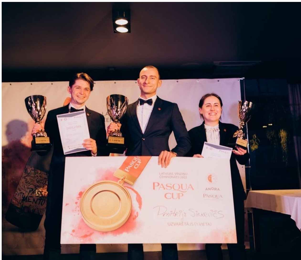
Latvijas vīnziņu čempionāta "Pasqua Cup 2022" pirmo trīs vietu ieguvēji.

Latvijas vīnziņu asociācija ik gadu pulcē jaunos Latvijas vīnziņus sacensties meistarībā, lai iegūtu gada vīnziņa titulu. Pirmo trīs vietu ieguvēji iegūst arī ceļazīmi uz Baltijas vīnziņu čempionātu Vana Tallinn Baltic Sommelier Grand Prix, kas ik gadu norisinās Tallinā.